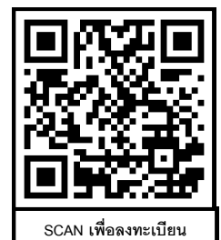
SCAN เพื่อลงทะเบียน

สมาคมสถาบันการศึกษาการธนาคารและการเงินไทย เลขที่ 7/2 อาคารลิขิต 2 ชั้น 4 ซ.ลาดพร้าว 23 ถนนลาดพร้าว แขวงจันทระเกษม เขตจตุจักร กรุงเทพฯ 10900 โทรศัพท์ 02-077-8093, 02-077-8286, 02-077-8291 หรือ www.tibfa.co.th, e-mail: info@tibfa.co.th